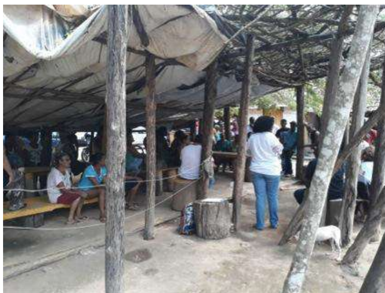
Figura 4: reunião em Messias Gomes, São José do Goiabal. 14 out 2018.

a presença de aproximadamente 100 moradores de Messias Gomes, Lagoa Luís Carlos, Lagoa das Palmeiras, Isidoro, Barra Alegre, Biboca e Patrimônio do Requerente (São José do Goiabal), e da Fazenda Santa Rita, (São Domingos do Prata). As pautas centrais foram a consolidação da Comissão de Atingidos, informações sobre o processo de escolha da Assessoria Técnica e discussão sobre a visita do Ministério Público ao território. A Comissão e os moradores atingidos assumiram a atribuição de mobilizar as comunidades para que participassem da reunião de apresentação do resultado do credenciamento, com o Ministério Público e a Fundação Getúlio Vargas no território. Também definiram a pauta de reivindicações para o município que consta no item 3 deste relatório (Caracterização do Território e Demandas).