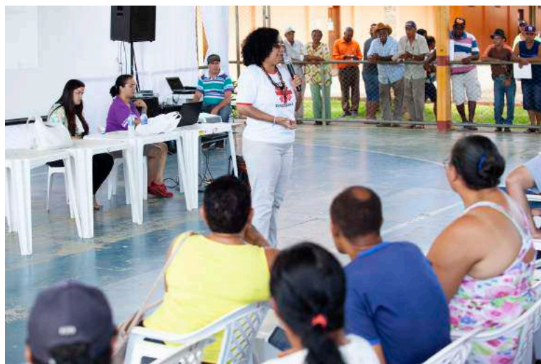
Figura 9: Comunidades chegam ao evento de escolha em São José do Goiabal. 16 dez 2018.

Lucimere iniciou explicando que a Cáritas se inscreveu para o processo de seleção de Assessoria Técnica porque mesmo antes do crime ambiental cometido pela Samarco contra o Rio Doce, a entidade tinha a sua Comissão de Meio Ambiente e, junto a outros movimentos sociais, criou o Fórum Permanente da Bacia do Rio Doce. Passou à história da entidade dizendo que a Cáritas atua no território há muito tempo – a Cáritas de Itabira tem 51 anos de existência e atua em 24 municípios da região – no total do Estado de Minas Gerais, são 14 unidades. É uma entidade dedicada à articulação social da igreja católica que, apesar da origem, tem atuação ecumênica. O objetivo é promover ações de defesa e efetivação dos direitos humanos e do desenvolvimento solidário e sustentável.