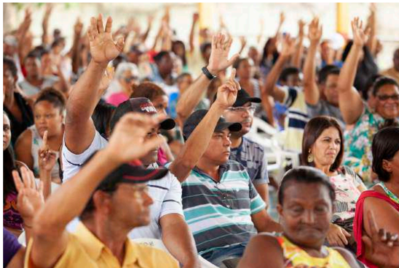
Figura 11: Momento da escolha. 16 dez 2018.

O Procurador afirmou, então, que a votação na urna não era necessária diante da clareza do resultado por contraste, da maioria bem ampla escolhendo a Cáritas. Apesar dos votos dados à Rosa Fortini, o grupo muito maior que optou pela Cáritas consagrava a Cáritas como vencedora do processo de escolha no território.