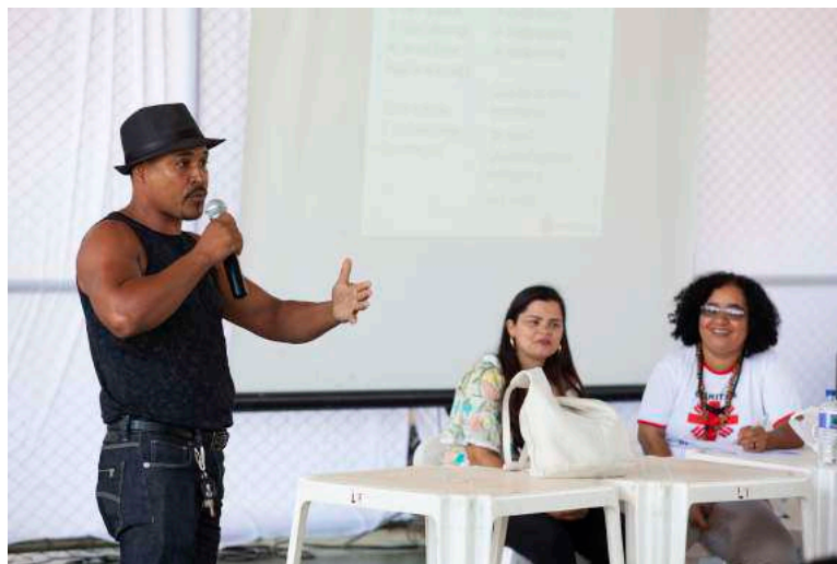
Figura 10: Perguntas à Cáritas. 16 dez 2018.

Atingida de Sem-Peixe, citando a carta do Nacab, quis saber por qual motivo a Cáritas foi às comunidades antes da reunião de escolha e as outras entidades, não. E também como será a contratação de profissionais pela futura Assessoria.