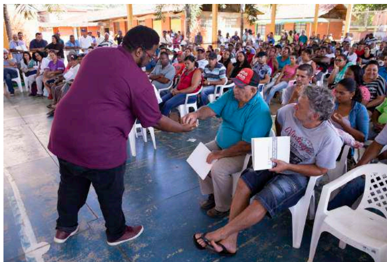
Figura 7: Sorteio da ordem de apresentações. 16 dez 2018.

- Ao fim das duas apresentações, os representantes das duas entidades se retirariam para que atingidos e atingidas deliberassem sobre as apresentações e fizessem sua escolha formalmente.