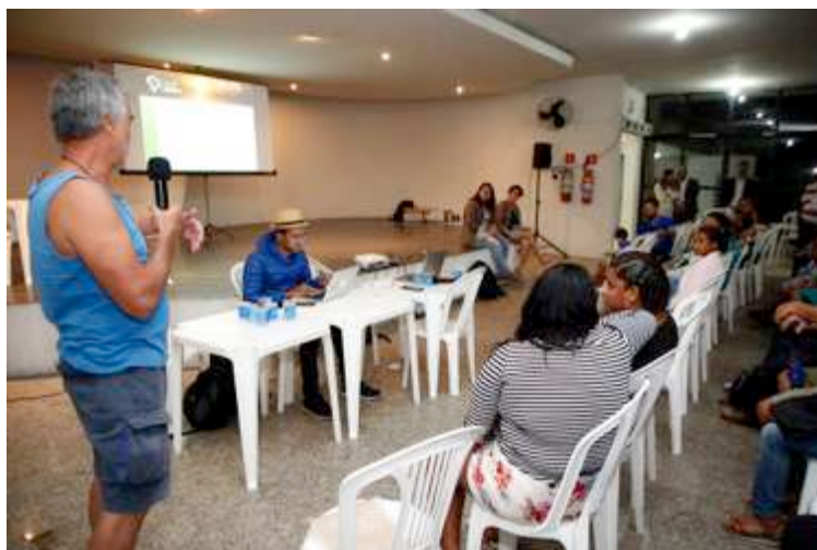
Figura 8: Atingidos e atingidas perguntam. 11 dez 2018.

“Gostaríamos de saber o que nos assegura de sermos atingidos como indígenas especificamente. Mesmo a gente em processo de reconhecimento, vamos ter esse atendimento específico, diferenciado?”, foi outra pergunta.