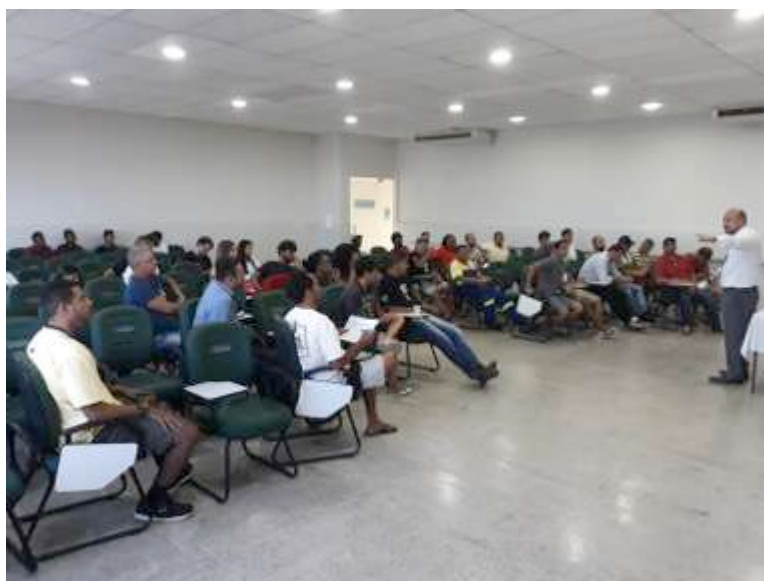
Figura 3: Reunião com surfistas. 23 ago 2018.