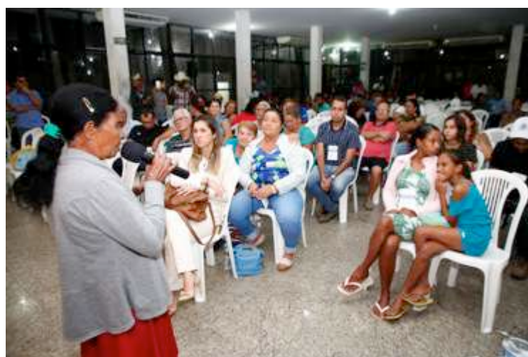
Figura 10: Deliberações. 11 dez 2018.

“Vimos que a Adai teve responsabilidade e foi a única [entidade] que mostrou interesse. Eu acho que é uma boa opção a gente ficar com a Adai”, disse o primeiro atingido.