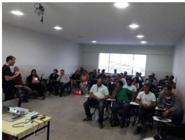
Figura 4: Apresentação da lista de entidades credenciadas. 09 nov 2018.

Em 9 de novembro, na sede da Procuradoria da República no Município de Linhares a equipe do Fundo Brasil apresentou à Comissão de Atingidos o resultado do credenciamento de entidades. Estiveram presentes 36 integrantes e também dois representantes da Lactec 4 .