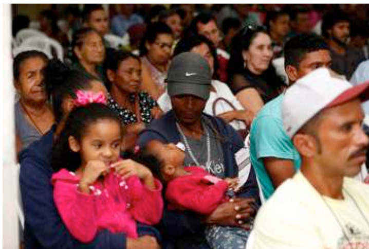
Figura 9: Família participa do evento de escolha. 11 dez 2018.

Sobre assessoria jurídica, a representante da Adai tentou ser mais específica: “A Assessoria é para todos os atingidos, independentemente se têm advogados particulares. Eu só quero ressaltar aqui que a equipe jurídica da Assessoria não vai fazer o papel da Defensoria Pública ou dos advogados particulares. Quem representa os atingidos coletivamente é a Defensoria Pública, quem representa individualmente o atingido é advogado particular. A Assessoria Técnica é coletiva. Assessoria Técnica é para todas as pessoas que foram atingidas pela Barragem de Fundão.