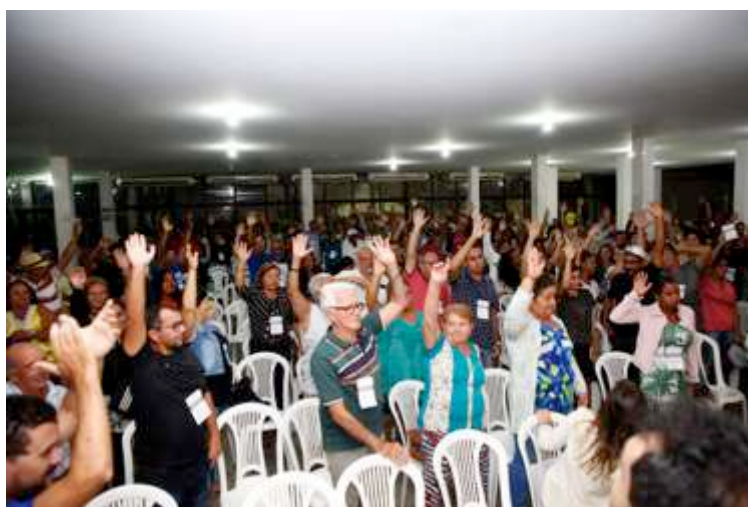
Figura 11: Adai é escolhida Assessoria Técnica de Linhares. 11 dez 2018.

Assim, a Adai foi escolhida por aclamação como Assessoria Técnica de Linhares, às 20h47 do dia 11 de dezembro de 2018.