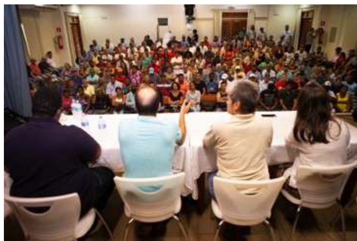
Figura 6: Mesa do evento de escolha. 30 nov 2018.

Uvanderson destacou, ainda, que, após a apresentação da AEDAS, uma etapa para perguntas seria aberta, com oportunidade para que as dúvidas em relação à atuação da entidade fossem esclarecidas. “Esse é o primeiro dia de trabalho dos atingidos de Aimorés com a Assessoria Técnica. É hora de entender o que ela vai fazer, a metodologia, o funcionamento. É um momento muito importante.”