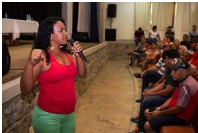
Figura 8: Perguntas à AEDAS. 30 nov 2018.

O representante do Fundo Brasil lembrou aos presentes que a fase de perguntas deveria priorizar dúvidas sobre o trabalho proposto pela AEDAS. Uma atingida começou a primeira rodada de questionamentos sobre o fato da Fundação Renova não reconhecer as mulheres pescadoras que trabalhavam como seus maridos, como profissionais da pesca, mas sim como dependente. Reforçou ainda que esse tipo de postura, mostra um comportamento machista por parte da Fundação Renova, criando sérios prejuízos as mulheres atingidas pelos rejeitos da Barragem de Fundão.