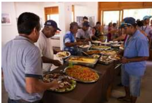
Figura 10: Almoço de encerramento. 30 nov 2018.

A reunião foi encerrada por volta de 12h10, com um convite aos participantes para o almoço: