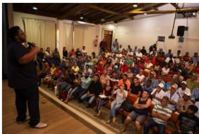
Figura 5: Abertura do evento de escolha da Assessoria Técnica em Aimorés. 30 nov 2018.

O evento de escolha da Assessoria Técnica para Aimorés ocorreu em 30 de novembro na sede do Instituto Terra.