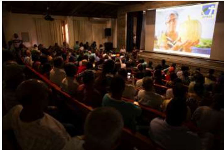
Figura 7: Apresentação da AEDAS. 30 nov 2018.