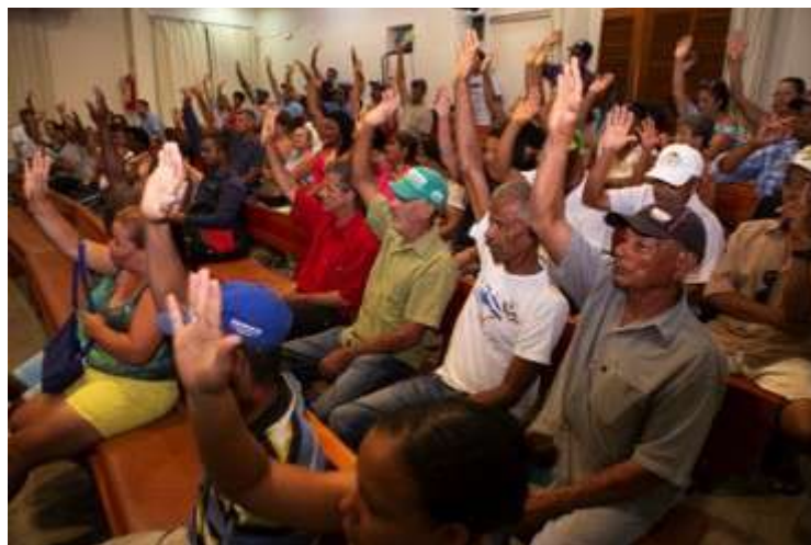
Figura 9: AEDAS é escolhida como Assessoria Técnica de Aimorés. 30 nov 2018.

Em seguida, fez a pergunta formal de escolha: “Quem escolhe Aedas como Assessoria Técnica de Aimorés, por favor, levante a mão”. Os atingidos e atingidas presentes levantaram as mãos; alguns também expressaram verbalmente um “sim”. Desta forma, a AEDAS foi escolhida por aclamação como Assessoria Técnica de Aimorés. O público celebrou com saudações e aplausos a escolha.