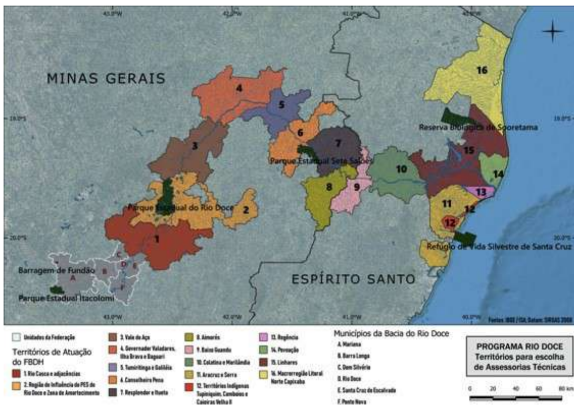
Figura 1: Territórios para escolha de Assessorias Técnicas. Cartografia: André Rodrigues de Oliveira/Fundo Brasil

Os mapas da figura 1, a seguir, e da figura 2 (pág. 4) mostram o Território 8 – Aimorés no contexto da Bacia do Rio Doce.