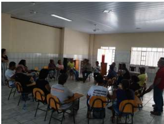
Figura 4: Reunião preparatória do evento de escolha. 6 nov 2018.

Sobre a metodologia do encontro, a Comissão de Atingidos decidiu que: a divulgação de data e local da reunião de escolha seria feita por emissora local de rádio e carro de som, ambos com contratação viabilizada pelo Fundo Brasil; seria necessária contratação de transporte para as localidades de Santo Antônio e Represa. Cada entidade teria uma hora para apresentar sua proposta e responder às perguntas de atingidos e atingidas. As formas de escolha seriam, na ordem: consenso, maioria por contraste visual e, por último, caso necessário, votação.