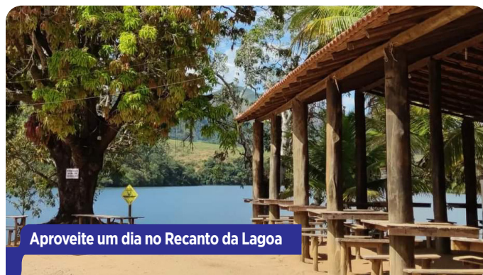
Aproveite um dia no Recanto da Lagoa