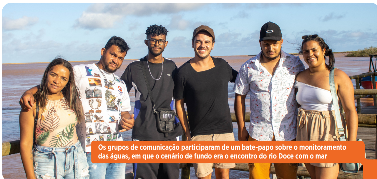
Os grupos de comunicação participaram de um bate-papo sobre o monitoramento das águas, em que o cenário de fundo era o encontro do rio Doce com o mar

A turma de Minas chegou em terras capixabas no dia 27 de janeiro e viu de perto a criação de abelhas sem ferrão, além de outros projetos que os moradores desenvolvem para ter uma fonte de renda alternativa à pesca.