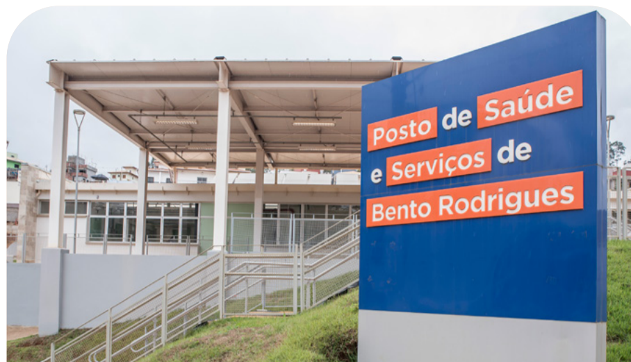
A obra do posto de saúde foi concluída em dezembro de 2020. A construção do bem de uso coletivo atende às normas de acessibilidade e sanitárias do Ministério da Saúde e da ANVISA.

A Secretaria de Saúde de Mariana vai oferecer diversos serviços gratuitos, por meio do Sistema Único de Saúde (SUS), como atendimento clínico geral, fisioterapia, odontologia e outras especialidades disponíveis nas demais unidades de saúde.