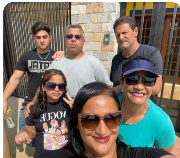
O casal, a filha, o genro e netos em frente ao seu novo lar, em Bento.

Outras 88 casas estão finalizadas em Bento Rodrigues, assim como a escola, os postos de saúde e de serviço, a ETE/ETA, a Igreja Assembleia de Deus e toda a infraestrutura. O distrito está pronto para receber as famílias e são elas que vão encher o lugar de vida e cultura.