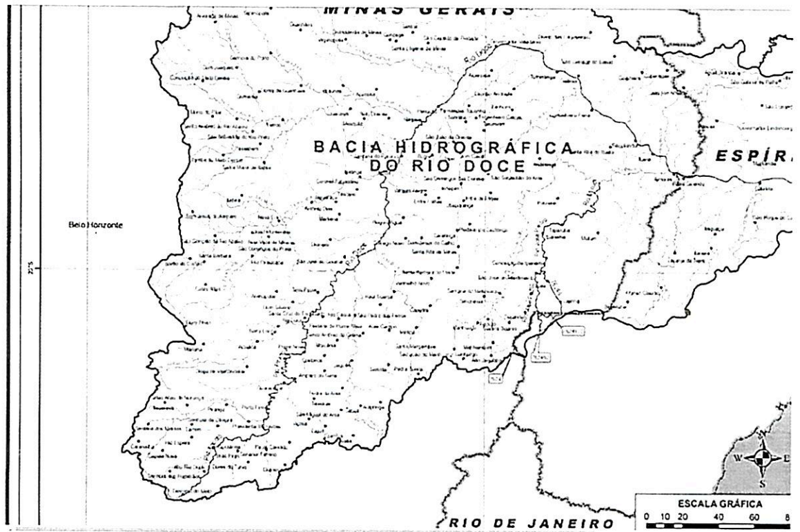
Figura 3- Bacia Hidrográfica do Rio Doce