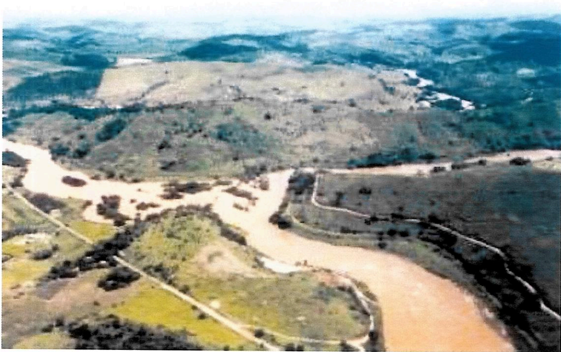
Foto da Confluência do rio Piranga e ribeirão do Carmo

Em relação aos impactos ambientais, o ofício cita alínea IV, da Cláusula primeira do TTAC, que define como município atingido pelo Evento aquele que faz divisa com a calha do Rio do Carmo. A divisa de Ponte Nova com o Rio do Carmo se estende por sete quilômetros. O ofício menciona os danos causados na ictiofauna do rio Piranga, que corta Ponte Nova. E destaca o alto endemismo do Rio Piranga, principal afluente do Rio Doce, que poderá atuar como vigoroso centro de recolonização da bacia do Rio Doce, fazendo da recuperação do Rio Piranga condição essencial para revitalização da bacia do Rio Doce.