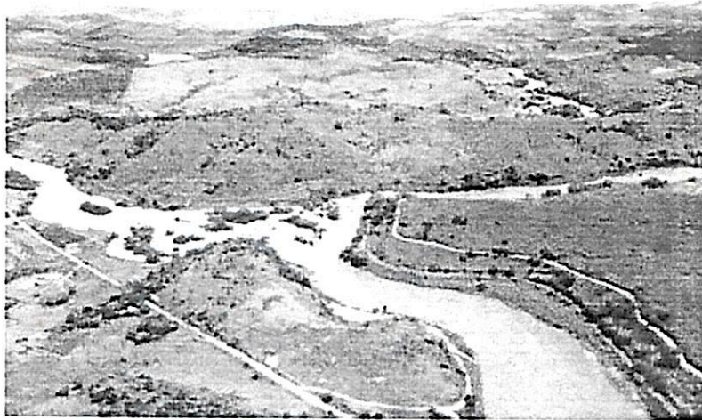
Figura 2- Confluência do rio Piranga e ribeirão do Carmo, formando o rio Doce

calha do Rio do Carmo, portanto, cabe a inserção do município no rol de municípios atingidos pelo rompimento das barragens.