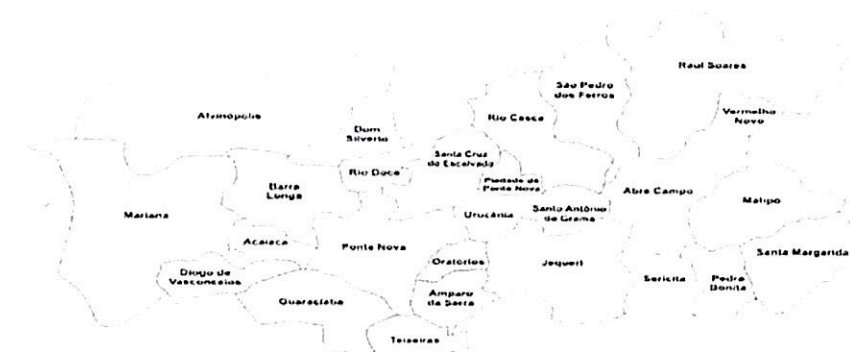
Figura 1- Mapa da Microrregião de Ponte Nova

Nas comunidades rurais que fazem divisa de Ponte Nova com Barra Longa, como na comunidade rural de Chopotó, 04 (quatro) famílias foram diretamente atingidas em decorrência do desastre da barragem de rejeitos da Samarco , tendo perdas de animais, pastagem, curral, rede de esgoto, rede de água, conforme relatório da EMATER (anexo III).