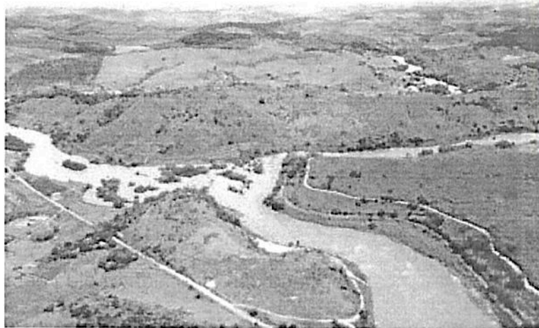
Figura 2- Confluência do rio Piranga e ribeirão do Carmo, formando o rio Doce

calha do Rio do Carmo, portanto, cabe a inserção do município no rol de municípios atingidos pelo rompimento das barragens.