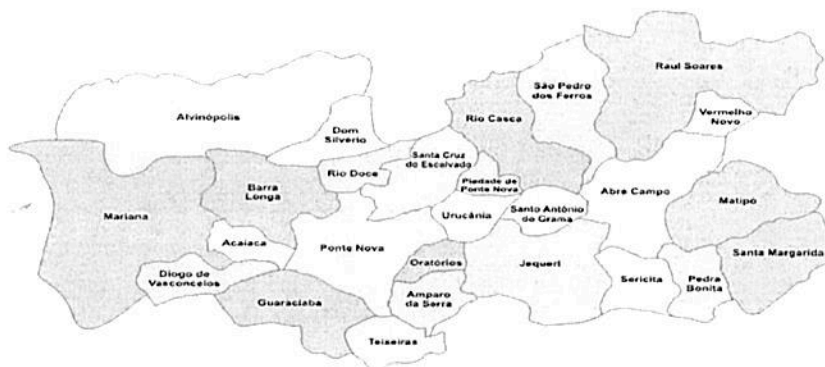
Figura 1- Mapa da Microrregião de Ponte Nova

Nas comunidades rurais que fazem divisa de Ponte Nova com Barra Longa, como na comunidade rural de Chopotó, 04 (quatro) famílias foram diretamente atingidas em decorrência do desastre da barragem de rejeitos da Samarco , tendo perdas de animais, pastagem, curral, rede de esgoto, rede de água, conforme relatório da EMATER (anexo III).