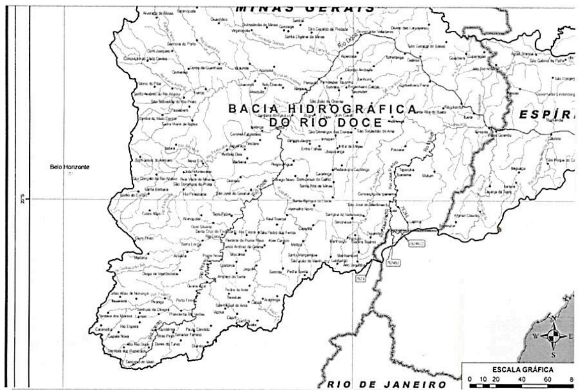
Figura 3- Bacia Hidrográfica do Rio Doce