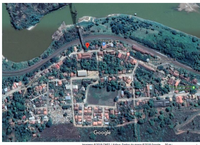
Figura 1: Distrito de Itapina, município de Colatina.

O Distrito de Itapina dista 38 km da sede de Colatina. O acesso é por via terrestre não pavimentadas e pouco sinalizadas. Colonizada por Italianos, Alemães, Sírios e Libaneses foi uma localidade de grande importância econômica por volta de 1900, com seus casarões, repartições, galpões de café e casas comerciais, que apesar de decadentes retratam a vida áurea do Distrito. Entre as principais edificações encontra-se