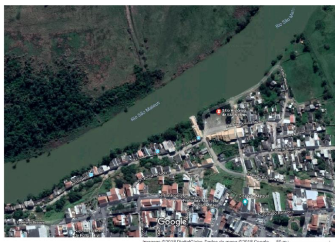
Figura 2: Sítio Histórico de São Mateus

O Rio São Mateus ou Rio Cricaré, deságua no Oceano Atlântico na cidade Conceição da Barra. Já o Rio Mariricu, um defluente do Rio Cricaré, deságua no Oceano Atlântico em Barra Nova, distrito de São Mateus. A deliberação 58º do CIF incluiu São Mateus e Conceição da Barra entre os municípios atingidos pela lama de rejeitos. Considerando que o Rio Cricaré está interligado a duas áreas com contaminação (São Mateus e Conceição da Barra), não pode ser descartada a presença de vestígios contaminantes em suas águas, que por apresentarem um nível bastante baixo já vinham sendo invadidas pelas águas salgadas do oceano , causando