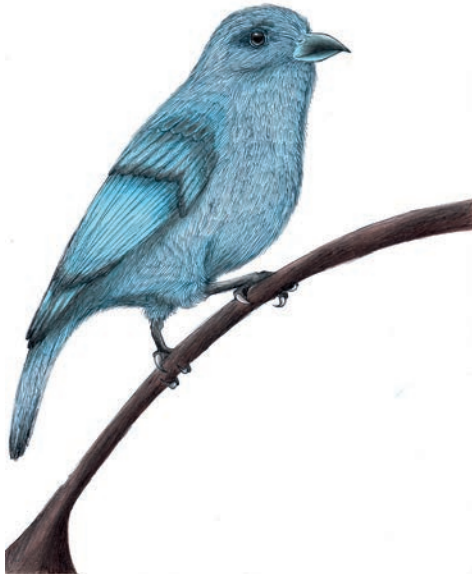
Desenho: Hévelin Grazieli Campista

O sanhaço-cinzento ocorre nas regiões Sul, Sudeste, Centro-Oeste e Nordeste do Brasil, ocorrendo em todos os biomas, exceto a Amazônia. É uma das espécies mais comuns no Brasil, ocorrendo em matas abertas, capões (ilhas de vegetação), matas ciliares, zonas